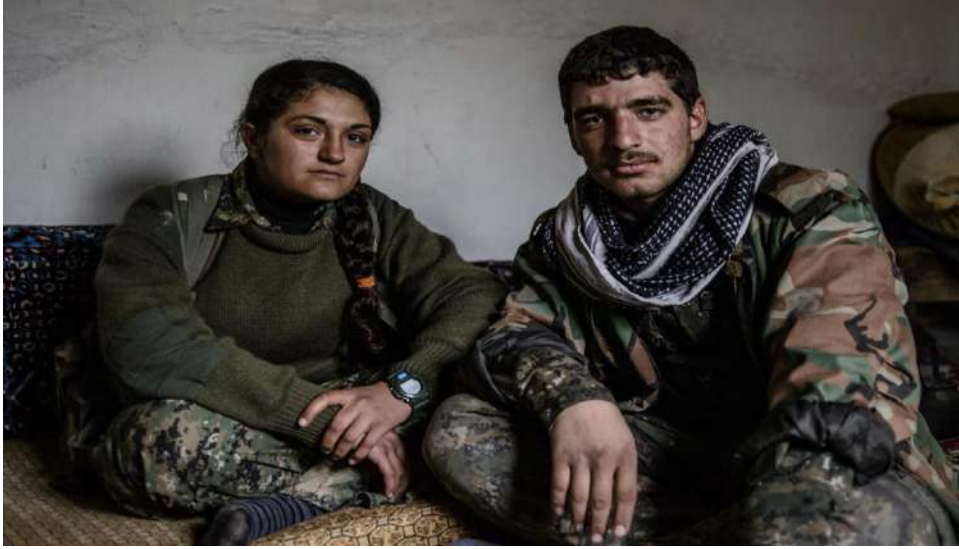
مقاتلين كُرد من وحدات حماية الشعب في بلدة هيراس - خط المواجهة مع داعش عام ٢٠١٤

مستوى الإقليم. يعمل المواطنون في لجان الصحة والبيئة والدفاع والمرأة والاقتصاد والسياسة والعدالة والإيديولوجيا. يحق لكل شخص إبداء رأيه. وعملاً بأفكار أوجلان بشأن المسائل المتعلقة بالمرأة، فإنّ مجالس المرأة تتمتع بسلطة نقض القرارات التي تتخذها المجالس الأخرى، عندما يتعلق الأمر تحديداً بمصالح المرأة.