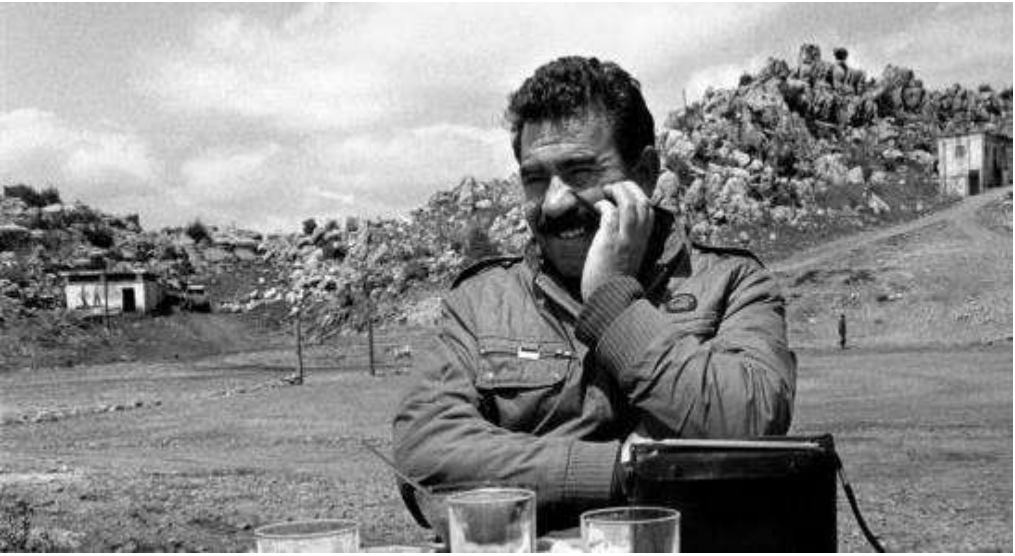
عبد الله أوجلان في معسكر تدريب لحزب العمال الكردستاني في سهل البقاع، لبنان ١٩٩١

أسِرَ أوجلان في كينيا عام ١٩٩٩ بعد أن اضطرَّ للخروج من سوريا -حيث عاشَ هناك لمدة عشرين عاماً- ثم نُقِلَ إلى جزيرة إيمرالي التركيّة النائية في بحر مرمرة الداخلي، وقد حوكم وأدينَ بتهم الخيانة، وخُفِّفَ حكم الإعدام الصادر ضده إلى السجن المؤبّد لأنّ تركيا كانت تحاول أنذاك الانضمام للاتحاد الأوروبي الذي يعارضُ عقوبة الإعدام. ومنذ ذلك الحين أوجلان مسجون في زنزانه يراقبها مئات الحراس في إيمرالي، مع عدد قليل من السجناء الآخرين إن وجدوا.