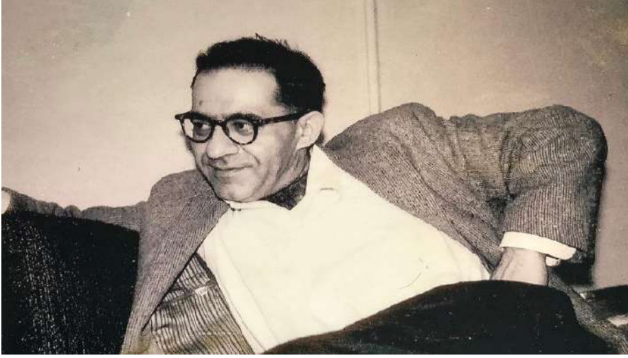
موراي بوكتشين، حوالي عام ١٩٥٠

تتنافس للسيطرة على سوريا، ومع ذلك، فإن نية العقد الاجتماعي واضحة؛ لبناء مجتمع قائم على أساس القاعدة الشعبوية والديمقراطية واللامركزية كالذي تصوره كل من والدي وعبد الله أوجلان على حدّ سواء.